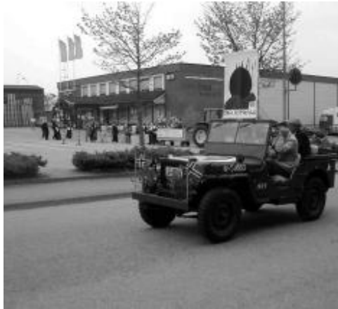
17.mai toget på Sola