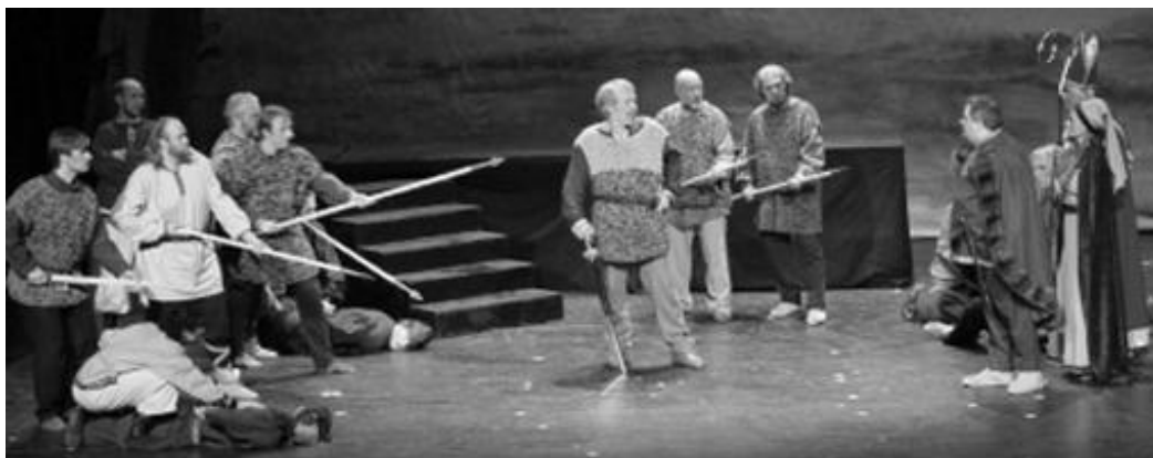
Rygekongen og arrangement i Ruinkyrkja