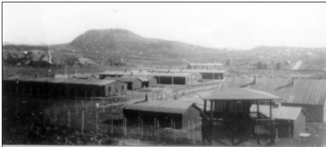
Over: Fra den russiske fangeleiren på Sola. (hvor idrettsplassen og Åsenhallen er idag.)